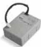
PS124 Аккумуляторная батарея 24В со встроенным зарядным устройством. 67,50 €