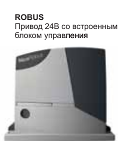
ROBUS Привод 24В со встроенным блоком управления