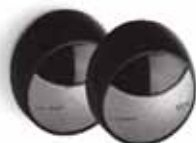
MOFB пара фотоэлементов