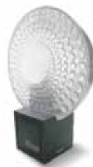
MLBT сигнальная лампа с антенной