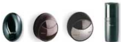
BF MOF MOFB F210 (FT210)