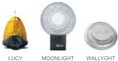
LUCY MOONLIGHT WALLYGHT