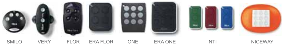
SMILO VERY FLOR ERA FLOR ONE ERA ONE INTI NICEWAY